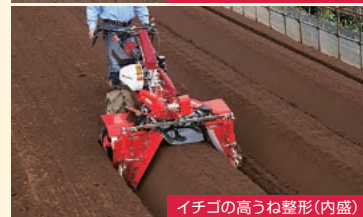
イチゴの高うね整形(内盛)