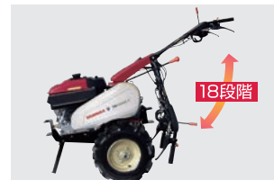
ハンドルロックレバー