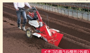
イチゴの高うね整形(外盛)