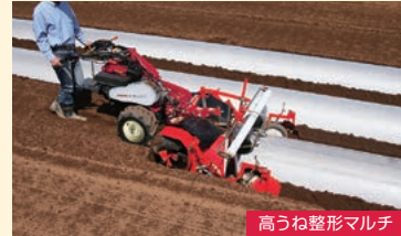
高うね整形マルチ