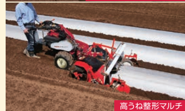
高うね整形マルチ