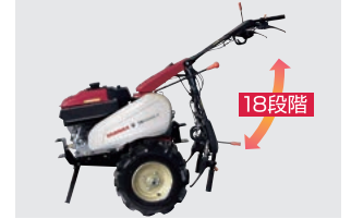
ハンドルロックレバー