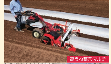
高うね整形マルチ