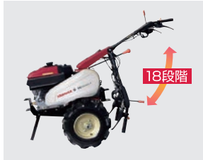
ハンドルロックレバー