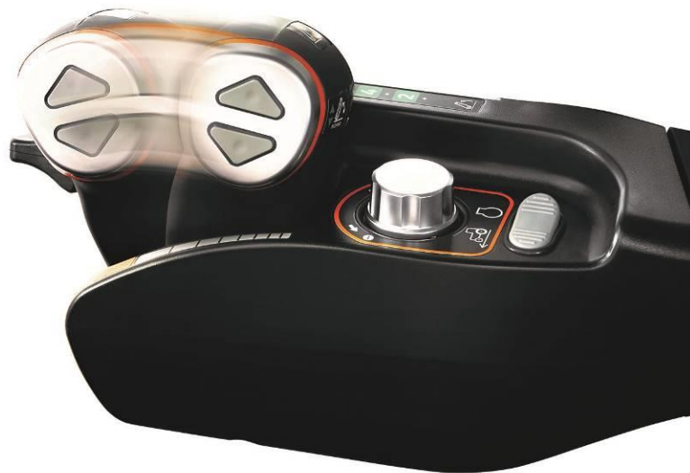
< 無段変速トランスミッション「I-HMT」を操作する変速レバーイメージ >

ヤンマーが独自に開発した伝達効率の高い無段変速トランスミッション「I-HMT」により、力強く安定した作業が可能です。無段変速のため、作業内容やほ場条件に合わせて最も効率の良い最適な速度で作業を行うことができます。変速時のショックもなく、美しい仕上がりを実現します。