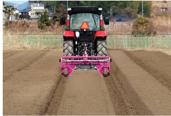
<直進アシスト機能によるあぜ塗り、うね立て作業イメージ>