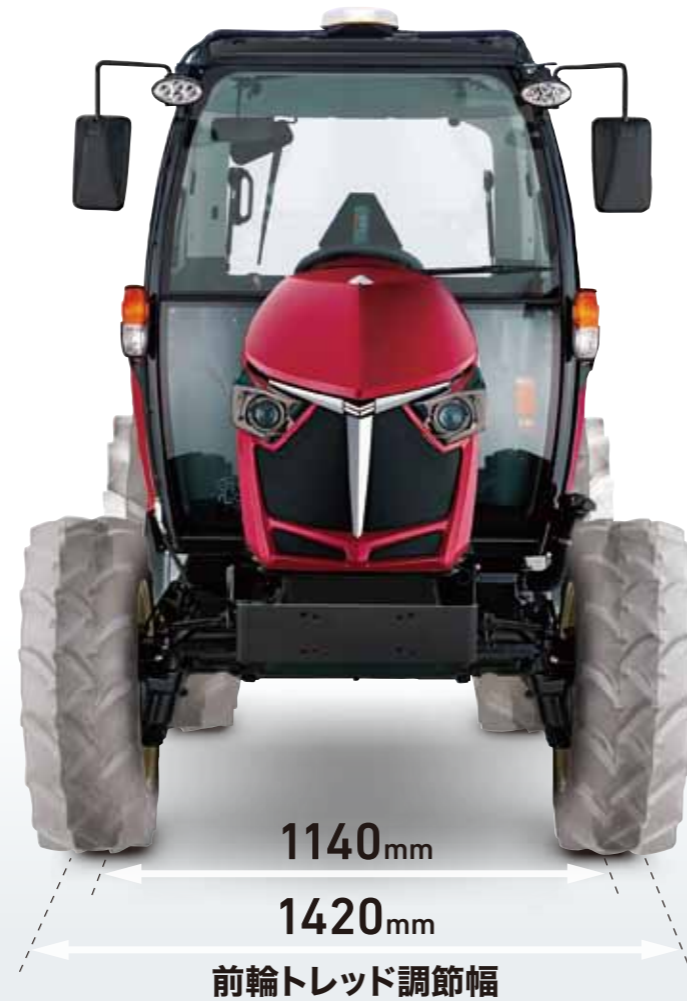
前輪トレッド調節幅