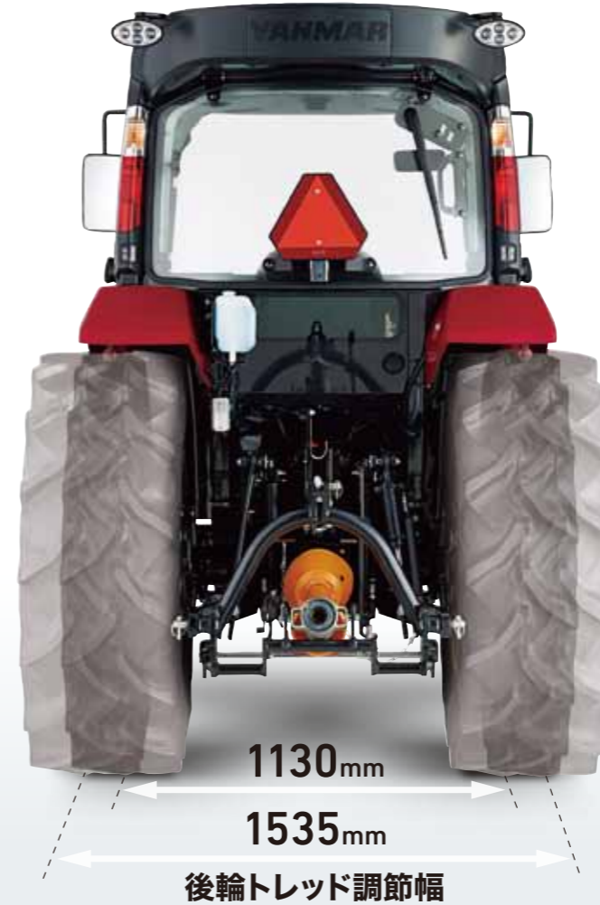
後輪トレッド調節幅