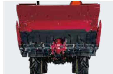
延長爪軸キット (センターロータリー用) 1B1500-29011-2 ※片側100mm