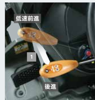
主変速コラムシフト