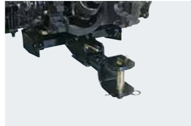
ドローバーヒッチ (リヤヒッチ併用) HIC-1303000