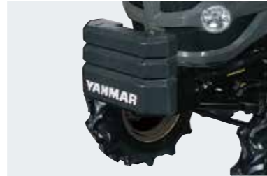
フロント補助ウエイト15kg (フロントベースウエイト併用) 7TS100-04001 ※最大2個装着可能