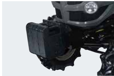
フロントウエイト20kg 1TS100-01001 ※最大3個装着可能