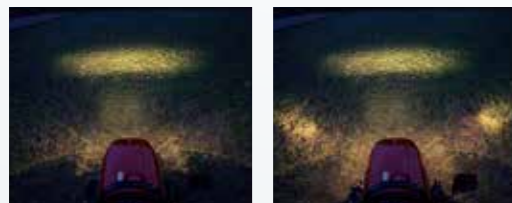
サイドビューライト2灯点灯 サイドビューライト4灯点灯