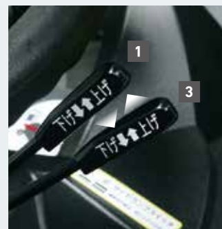
ワンタッチ昇降レバー