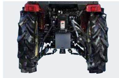
スリーポイントヒッチ ※UFO仕様除く (リヤヒッチ併用) 7T6964-19200