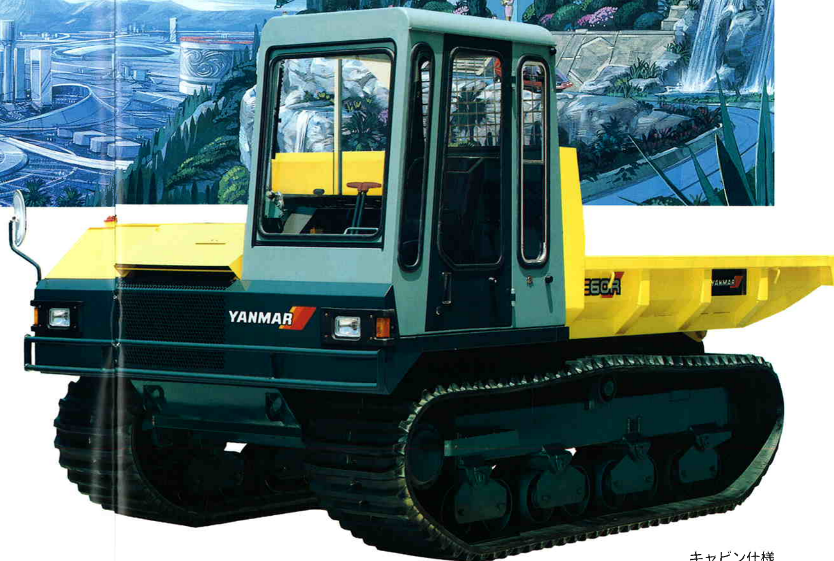
キャビン仕様 (オプション)

美しい街、快適な住まい、楽しい環境…、 豊かな未来を創造していくために、人と共に働く建設機械。 静かで安全、乗り心地がよくてラクな操作性、やさしいところを持った建設機械を、 独創的な技術で、ひと・まち・美しい地球へ。 それが未来にむかってヤンマーがめざす、新しい商品づくりです。