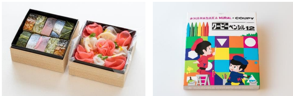
<左:「HANASAKA 寿司重」、右:「HANASAKA MURAL クーピーペンシル」>

実施内容: 開業を記念し、8階桜フォトスポットにて写真撮影および SNS 投稿をいただいた方(各日先着100名様)に特製「HANASAKA 寿司重 ※2 」をご提供します。また小学生以下のお子様同伴の方には「HANASAKA MURAL クーピーペンシル ※2 」(先着数量限定)などもプレゼントします。