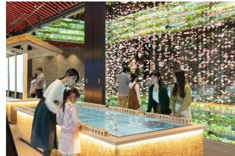
<「ヤンマー米ギャラリー」内観>

公式サイト: https://yanmar.com/jp/komegallery/