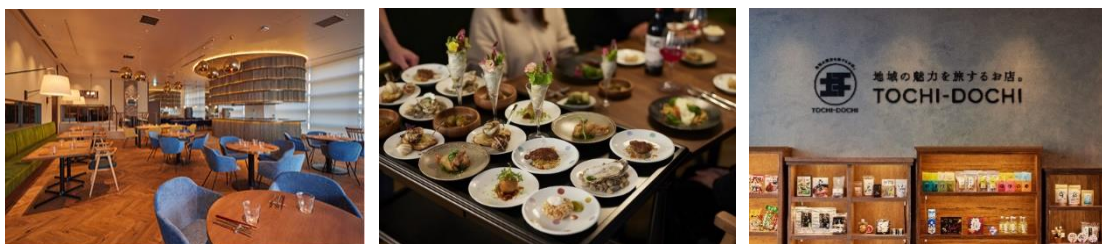
<左:「ASTERISCO」内観、中:「YUMCHA STYLE」ワゴンサービス、右:「TOCHI-DOCHI」内観>

公式サイト: https://www.tochidochi.ana.co.jp/