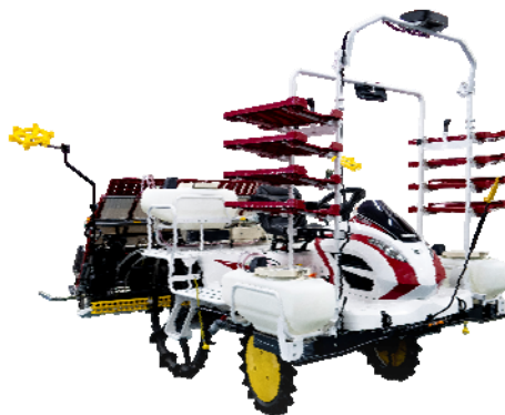
〈ペースト施肥田植機〉