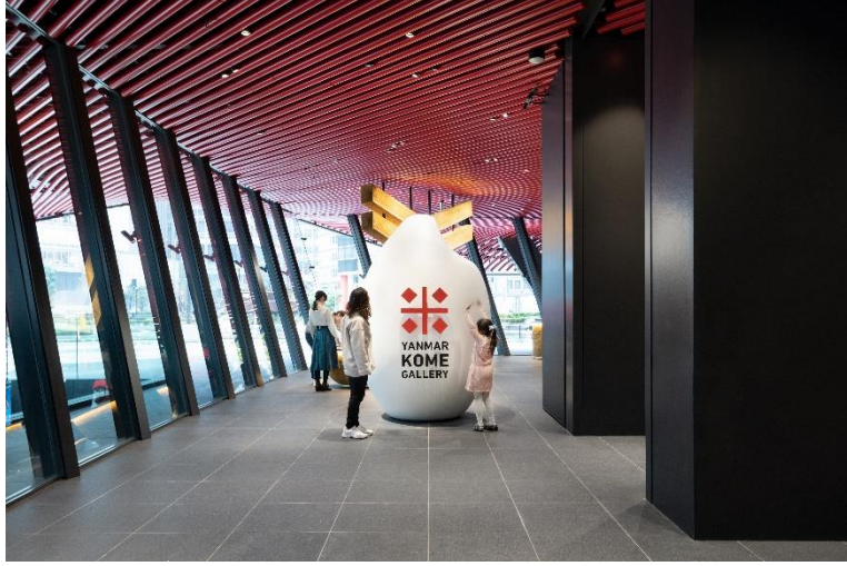
YANMAR KOME GALERİSİ

*Kome Japonca' da "çeltik" anlamına gelmektedir.