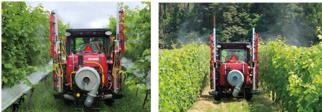
<左：1 段目散布で下方から散布、右：2 段目散布で上方から散布>

左右調整式ノズルにより、垣根幅 2.3~2.6m の作付体系に適応。エアアシスト・2段散布で効果的な散布が行えます。エアアシストで下から風を吹き上げ、葉を浮かせることにより 1 段目の散布で葉裏や奥まで薬剤を散布。2 段目は上から葉の表面に散布することで、全体を均一に防除することができます。