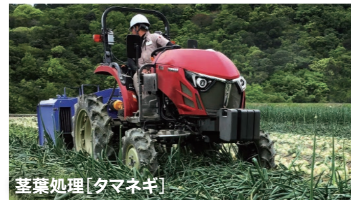
茎葉処理[タマネギ]