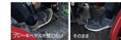
ブレーキペダルを踏むだけ そのまま

作業中でも走行中でもブレーキペダルを踏み込むだけで停止。クラッチペダルを踏み込む必要がありません。