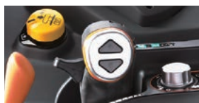
チョイ上げ・チョイ下げスイッチで、ピックアップ部の微調整が可能

トラクター側の「チョイ上げ・チョイ下げスイッチ」で、ピックアップ部の上下調節が可能。ほ場状態や草の状態に合わせて、手元で簡単に調節できます。