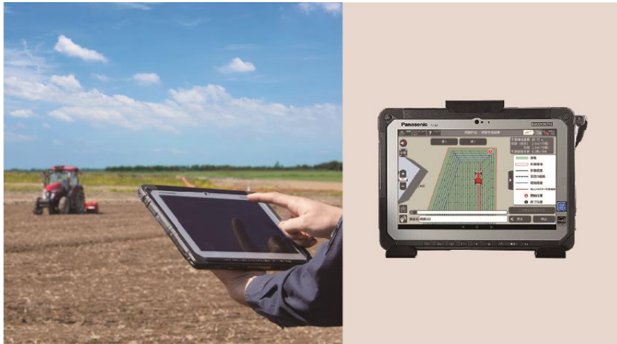
<タブレット イメージ>