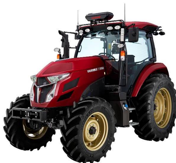
< ロボットトラクター「YT4R/5R シリーズ」 >

ヤンマーホールディングス株式会社のグループ会社であるヤンマーアグリ株式会社(本社:岡山県岡山市、社長:増田長盛、以下ヤンマーAG)は、近距離監視にて無人での自動作業を実現するロボットトラクターと、最小限の操作を有人で行い、直進作業・旋回を自動で誰でも熟練者並みの作業ができるオートトラクターをモデルチェンジし、3月1日(金)に発売します。