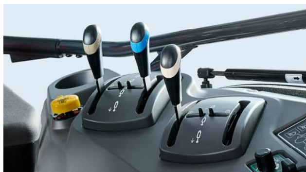
<タッチパネル式カラーモニターとサブコントロールレバー>

商品ページ URL: https://www.yanmar.com/jp/agri/products/tractor/yt488r_yt498r_yt4104r_yt5114r_ra/