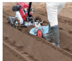
ミニアポロ培土器 [丸うね]

いろいろな作業に使えます。アタッチメントをセットすれば、作物にあった多彩な作業が行えます。