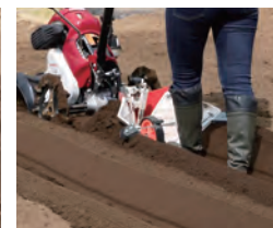
ミニうね立て器 [台形うね]