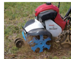
ブルースパイラル [除草]