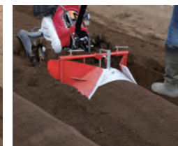
内盛整形器 [丸うね (台形うね)]