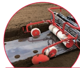
直播・播種マルチ