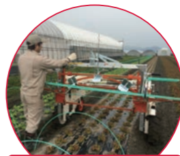
トンネル・マルチ張り/除去