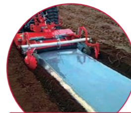
うね立て整形(マルチ)