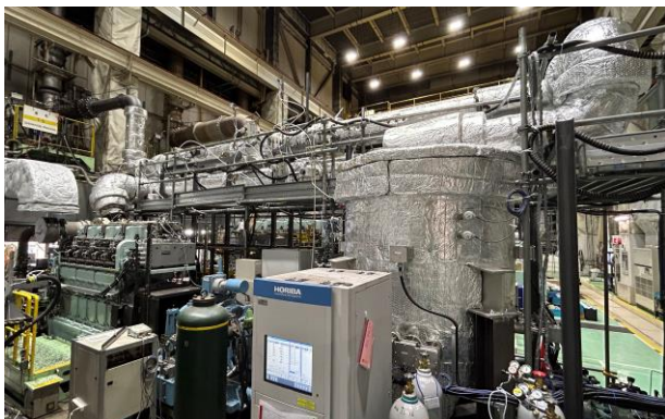
【メタン酸化触媒システム試験ベンチ】

日立造船、商船三井、ヤンマーPT は、本事業を通じて早期にメタンスリップ削減技術を確立させ、国際海運分野における温室効果ガスの排出削減に積極的に貢献していきます。