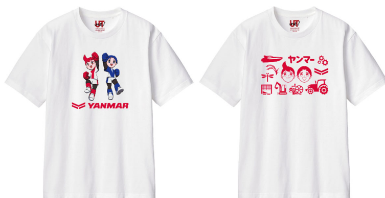
＜UTme!を使用して作成した T シャツ例＞

ヤンマーホールディングス株式会社は、東京・銀座の UNIQLO TOKYO とオリジナルアイテム作成サービス「UTme!」でのコラボレーション企画を開始します。ユニクロのグローバル旗艦店である UNIQLO TOKYO およびユニクロ銀座店の 2 店舗で、ヤンマーの農業機械やヤン坊マー坊などのスタンプを使ってオリジナルの T シャツとトートバッグを制作できます。販売期間は 2025 年 6 月 6 日(金)から 2026 年 5 月 31 日(日)までです。