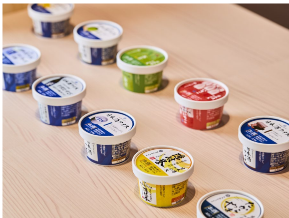
＜日本酒アイス 商品イメージ＞