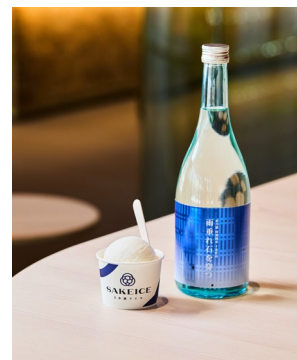
<日本酒アイス「雨垂れ石を穿つ 渡船」>

また、環境にやさしい米作りの食体験として、「SAKEICE Tokyo Shop」において、バイオ炭を活用した酒米で仕込んだ日本酒「雨垂れ石を穿つ 渡船」※のアイスの販売も開始します。米作りで発生するもみ殻を有効活用し作られるバイオ炭は、地中の炭素を固定する働きがあり、CO 2 排出量を削減できることに加え、土壌改良にも役立ちます。日本酒の酒米栽培に使用したバイオ炭は、ヤンマーの装置で製造されており、当社の循環型農業を支援する取り組みの一つです。