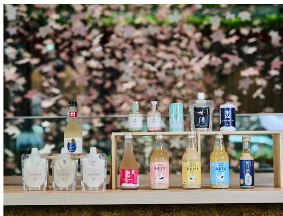
＜甘酒 商品イメージ＞