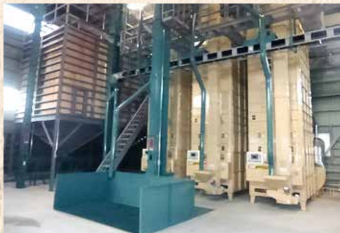
籾タンク・荷受けピット・乾燥機