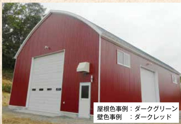
屋根色事例：ダークグリーン 壁色事例：ダークレッド