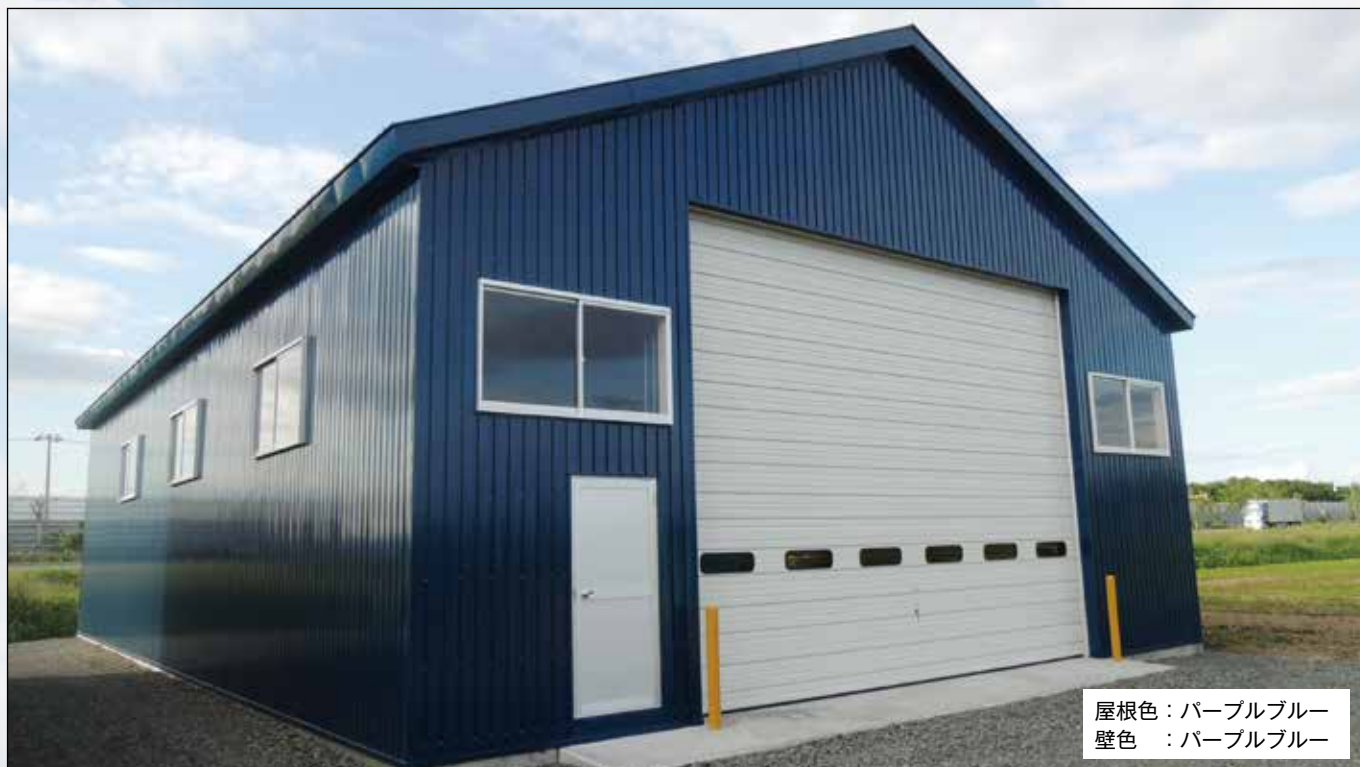
屋根色：パープルブルー 壁色：パープルブルー