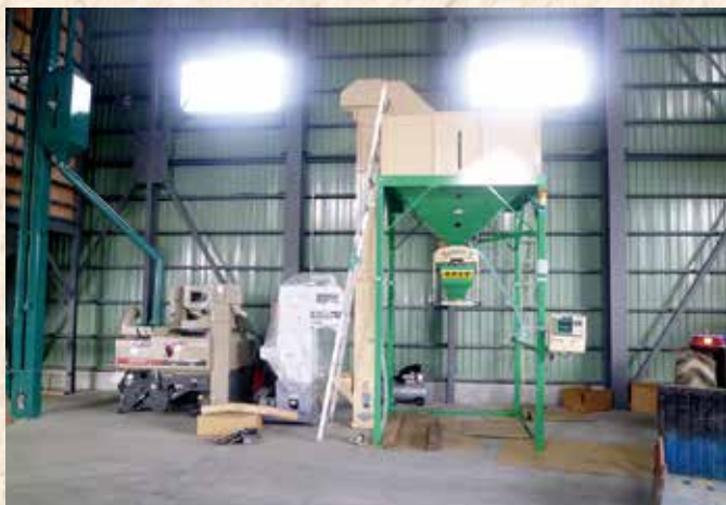
籾摺り機・選別機・計量ユニット