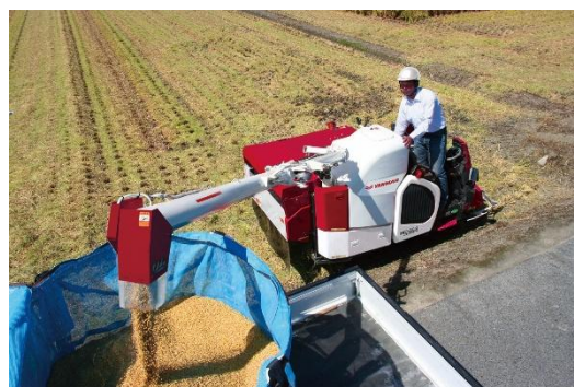
＜「オーガシュータ」(左)、「YH220A」での籾排出作業(右)＞