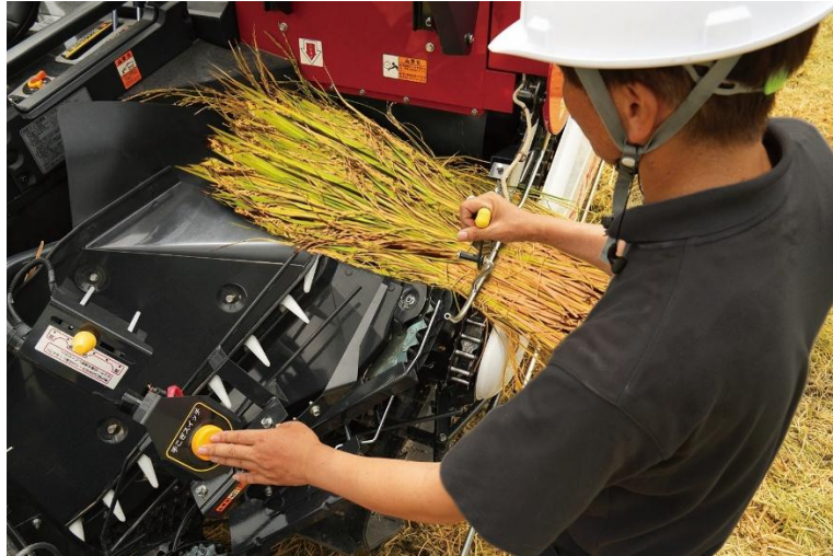
<手こぎ安全装置(写真は「YH323A」)>