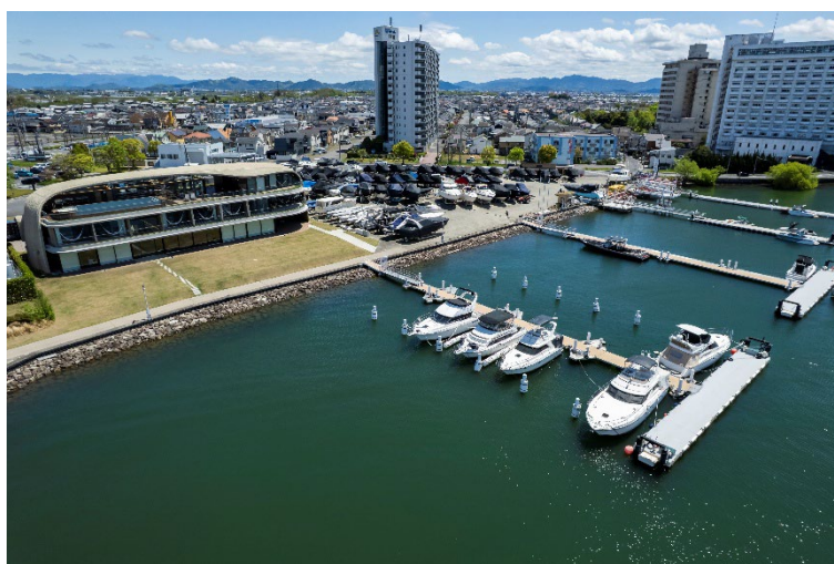
<ヤンマーサンセットマリーナ全景>

ヤンマーホールディングス株式会社の関係会社であるヤンマーコーポレーション株式会社が運営する「ヤンマーサンセットマリーナ」(滋賀県守山市)が、「ブルーフラッグ認証」を 2 年連続で取得しました。ブルーフラッグとは、デンマークの国際 NGO「FEE(国際環境教育基金)」による海水浴場・マリーナ・観光船舶を対象とした国際的な環境認証であり、環境教育、管理体制などに関する厳格な基準を満たすことで取得できます。ヤンマーサンセットマリーナは、2025 年に湖のマリーナとしてアジアで初めて同認証を取得しました。