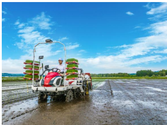
<移植作業 イメージ>