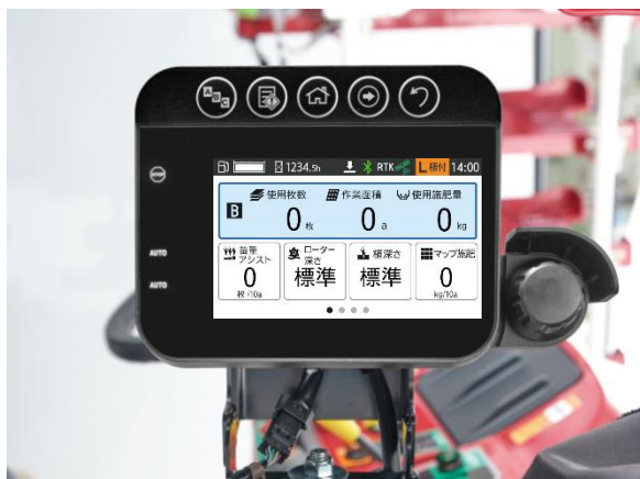
<カラーディスプレイ イメージ>

作業設定を一画面に集約したカラーディスプレイを新たに搭載しました。直感的な操作と見やすい画面で、簡単に各機能の設定や機体状態の確認が行えます。また、リバーサーレバーによりハンドルを握ったまま指先だけで前後進の切り替えが可能です。クラッチ操作なしでスムーズな運転ができ、切り返しの多いほ場での疲労を軽減します。