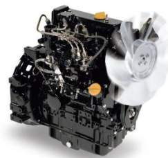
<高馬力ディーゼルエンジン「3TNV76」>

従来機から約 10%出力アップした 23.4PS の高馬力ディーゼルエンジン「3TNV76」を搭載。「メカ式」「HST」、2つのミッションの長所を兼ね備えて伝達効率のよさと操作のしやすさを両立したヤンマー独自のトランスミッション「HMT」により、馬力ロスも少なく、余裕を持って田植え作業が行えます。