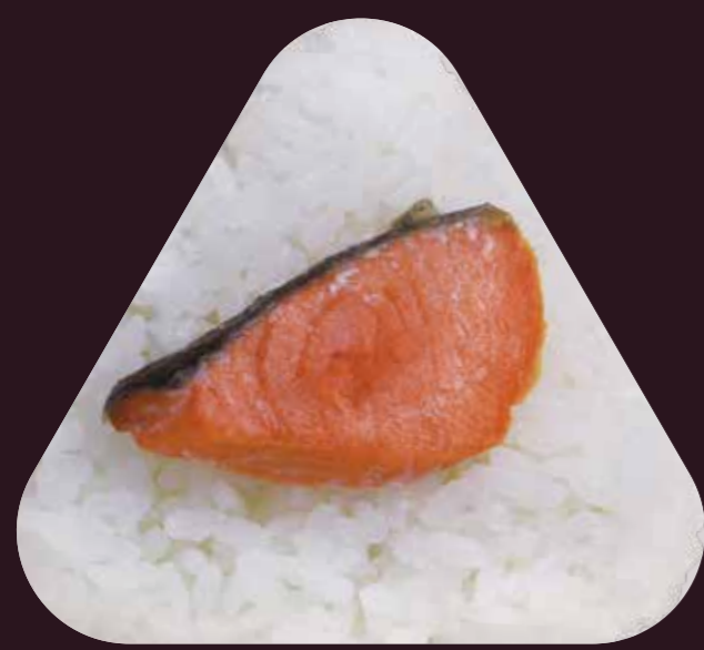
やき じゃけ 焼 鮭