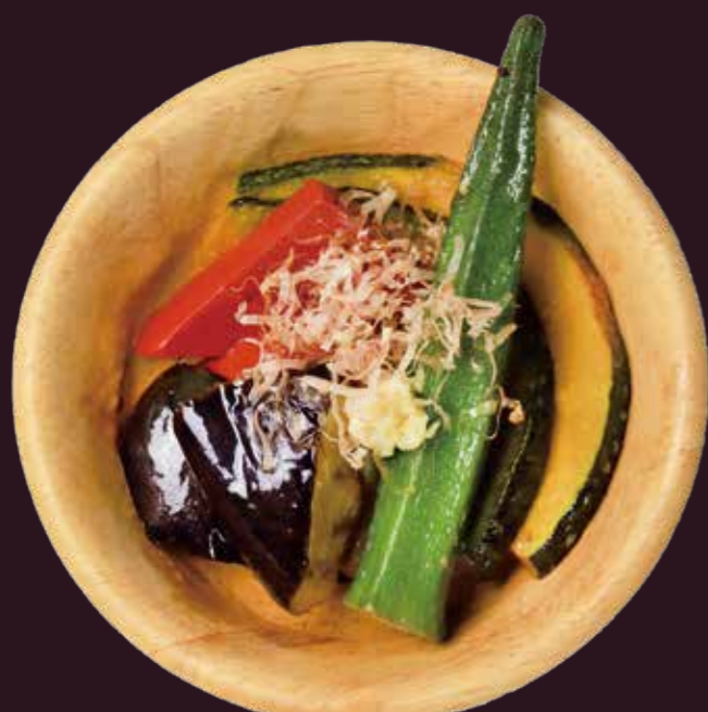
あか 赤こんにやくと なつ や さい に 夏野菜の煮びたし