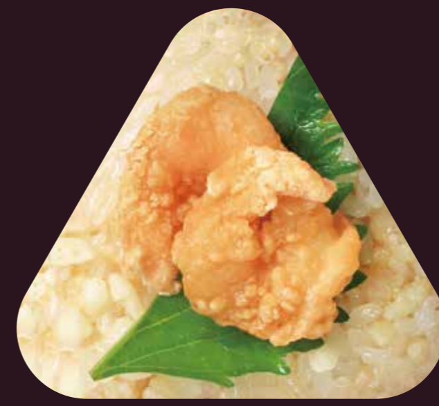
え び てん ふう 海老天風おむすび