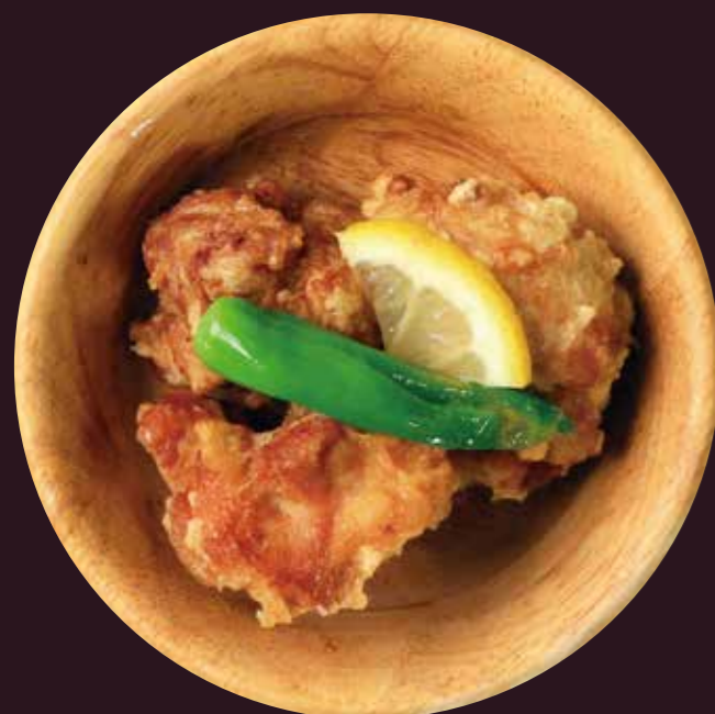
しょう ゆ ダイコウ醤油 しろ しょう ゆ つか 白ダシ醤油を使った うま から あ 旨だし唐揚げ