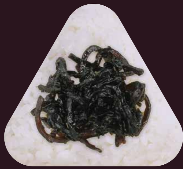
こん ぶ しそ昆布