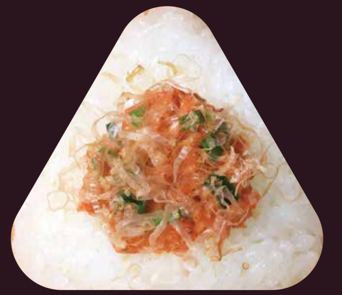
めん たい かつお明太マヨ