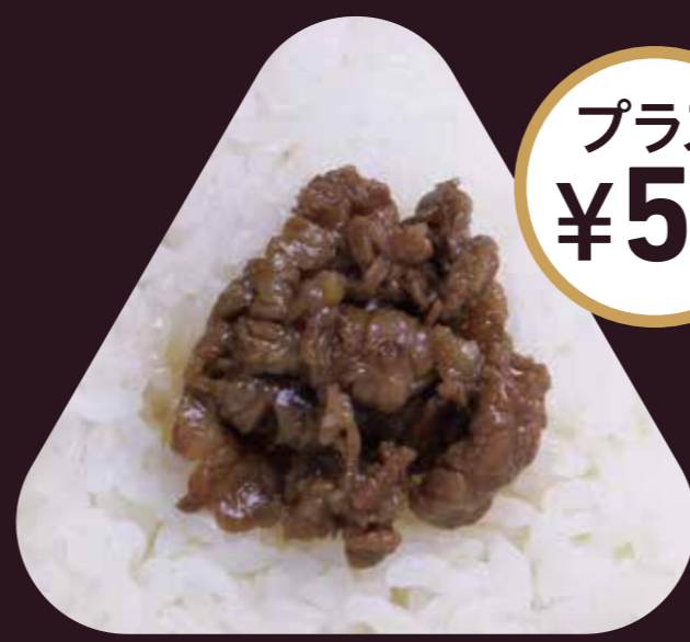
おう み ぎゅう 近江牛しぐれ