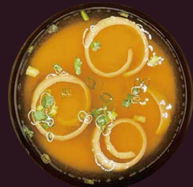
しが けん 滋 賀 県 りょうぜん さん ぞう み そ 靈仙三蔵味噌