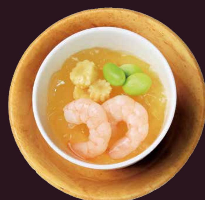
とうもろこしの フラン